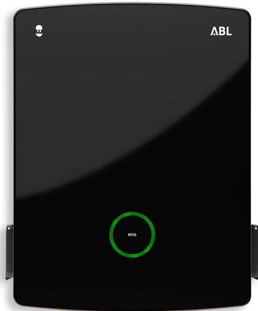
Número de producto 100000320

Su diseño robusto y su fabricación de alta calidad protegen el Wallbox eM4 Twin de las influencias externas. El Wallbox está preinstalado y listo para la conexión gracias al equipamiento de serie con interruptor diferencial tipo A y dispositivo de detección de corriente CC. Todos los Wallboxes de ABL son "Made in Germany" y ofrecen los más altos niveles de seguridad.